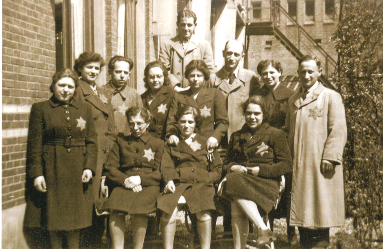
Personeel van het Joods Bejaardentehuis in de tuin achter Gebouw De Haven