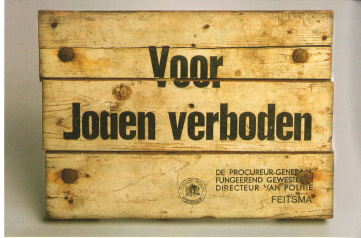
Bord Voor Joden verboden

Midden jaren dertig woonden rond de 200 Joden in Gouda. De populatie dijde in de volgende jaren uit, doordat steeds meer vluchtelingen uit Duitsland en Polen hier hun toevlucht zochten. Het bombardement op