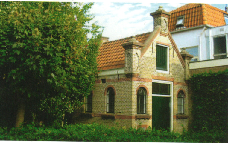
Het Metaheerhuis in de tuin van gebouw De Haven. Binnen staan op drie plaquettes de namen van alle omgebrachte Joodse Gouwenars.

Veel inwoners van Gouda steunen het project. Vrijwilligers helpen ons en leerlingen van het Wellant College. De afspraak met de gemeente is, dat de Stolpersteine in een vierkant ter grootte van negen grijze keitjes worden geplaatst. De Wellantleerlingen bereiden deze plekken zodanig voor, dat Demnig makkelijk de Stolpersteine erin kan metselen. Leerlingen van een basisschool adopteerden twee Stolpersteineplekken in de buurt; andere basisscholen organiseren projecten als een speurtocht langs de stenen. Een stagiaire geschiedenis hielp mee om de gegevens voor een van de plaatsingen uit te zoeken. De stenen zijn van grote waarde voor de familie van de slachtoffers en voor nu bejaarde vroegere klasgenootjes. Ook voor veel huidige bewoners van de huizen