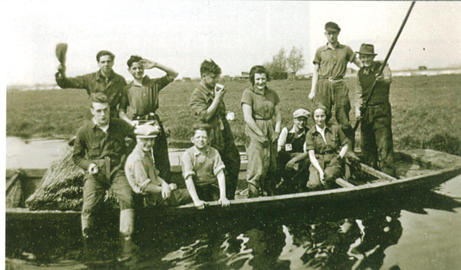
Leerlingen van de Jeugdfarm in de polder Bloemendaal