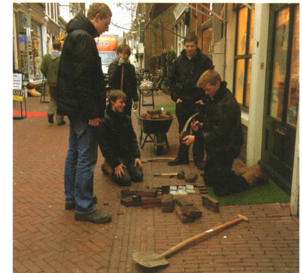
Leerlingen van het Wellant College bereiden een Stolpersteineplek voor in de Lange Groenendaal

De afgelopen drie jaar kwam Demnig drie keer Stolpersteine plaatsen in Gouda. Op 28 april 2011 plaatste hij de eerste Stolpersteine op 4 adressen. De gemeente gaf ons subsidie voor deze eerste zeven stenen, verder komt het geld van particulieren, instellingen en bedrijven. Eind augustus 2012 plaatste Demnig gedenkstenen op 21 locaties en eind februari 2013 op 9 plekken. Veelal waren het sobere plechtigheden met rond de twintig